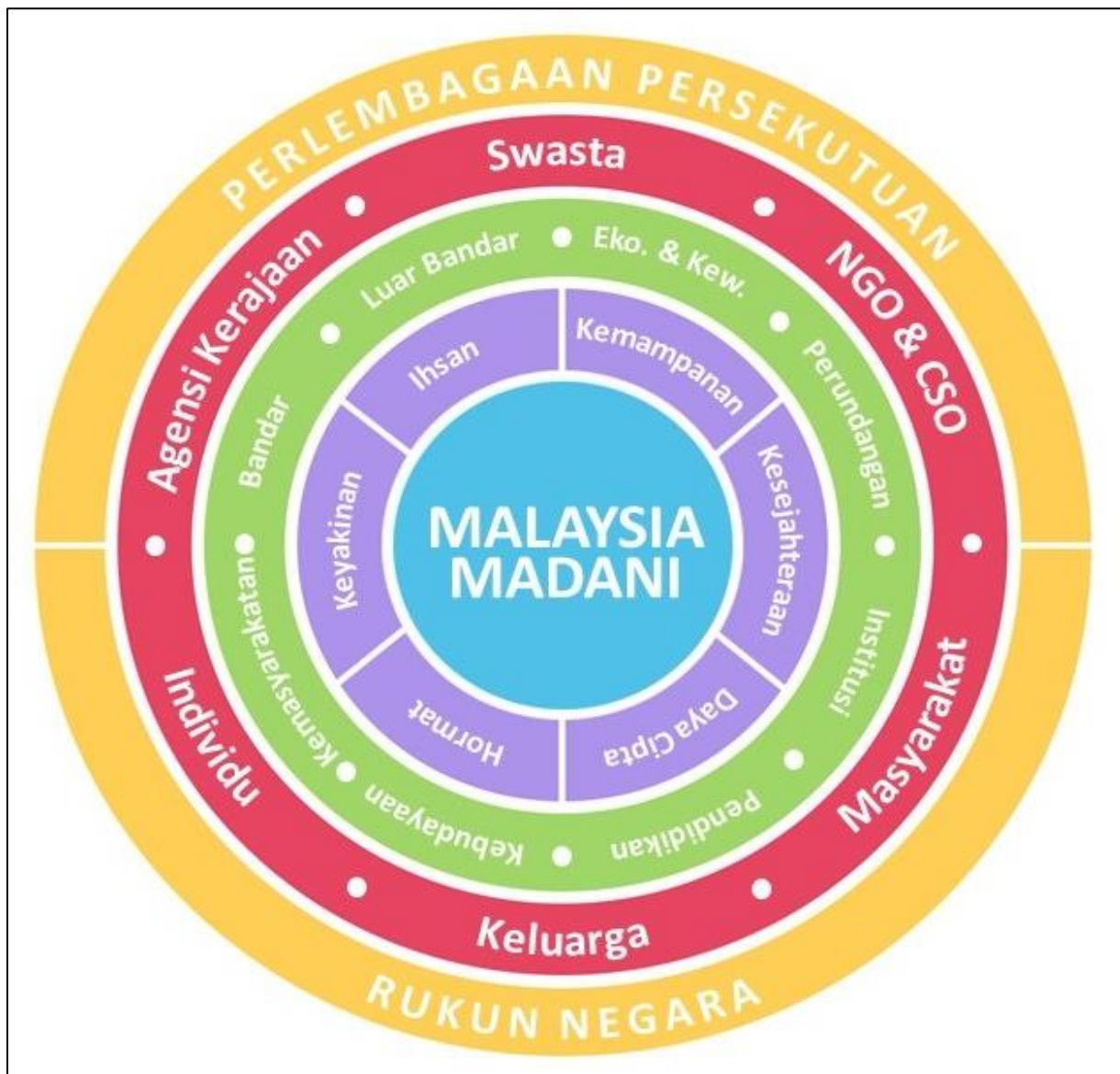
Rajah 1: Kerangka Membangun Malaysia MADANI

21. Kerangka Membangun Malaysia MADANI (Rajah 1) menjelaskan secara umum bagaimana gabungan komponen penting saling berhubung dalam melaksanakan peranan ke arah pembentukan Malaysia MADANI.